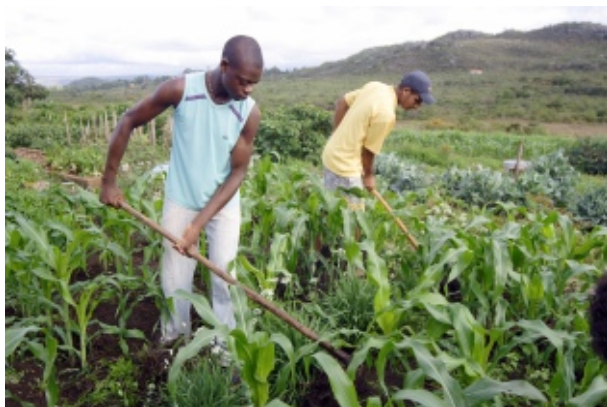
Lei 11.718 beneficia os agricultores que trabalham por safra

A Lei nº 11.718, sancionada pelo presidente da República no último dia 23 de junho, aumenta a formalização no campo e facilita a obtenção da aposentadoria rural. O dispositivo legal simplifica a contratação de trabalhadores rurais por curtos períodos e ao mesmo tempo permite que eles mantenham vínculo com a Previdência Social. A medida é mais um mecanismo de inclusão previdenciária.